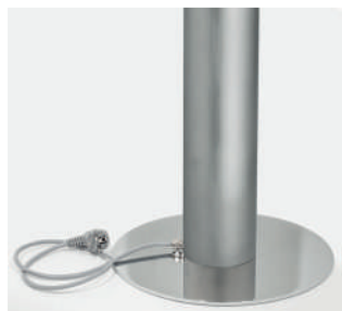
Base portante finitura cromo Supporting base finish chrome